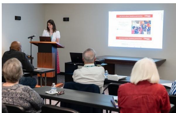
Lancement du partenariat Résidences d'Artistes