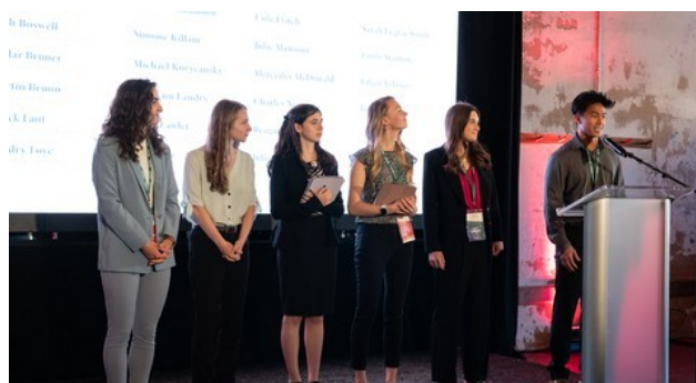
Restitution par les étudiants des thématiques abordées lors des 4èmes rencontres

Un laboratoire collaboratif entre les universités est en cours de réflexion, visant à maintenir et agrandir ce groupe de travail dynamique et prometteur.