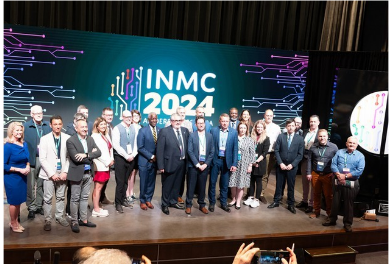
Cérémonie d'ouverture à l'Université d'Anderson