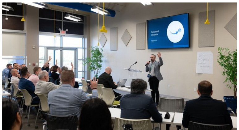
Présentation du partenariat : Corridor des Incubateurs

Au-delà des discours, les journées suivantes ont été structurées autour de divers ateliers thématiques, "labs", chacun focalisé sur des enjeux cruciaux du développement urbain