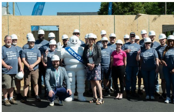
Création d'une maison sociale pour les femmes isolées à Anderson

La présentation du centre social Gisèle Halimi par Clermont-Ferrand a, quant à elle, incité les participants à se réinterroger sur le choix fait par une Mairie d'ouvrir un centre gratuit multi services.