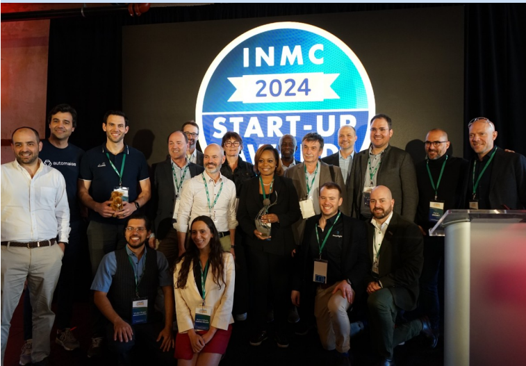
StartUp et Jury International du 1er concours de StartUp INMC

A l'issue du concours, un jury international a sélectionné les deux StartUp gagnantes : 1er Prix (Trophée réalisé par Laurent Sarpedon - 5000 usd + 5000 usd en pack marketing) remis à Health Evolve Technologies d'Anderson et le 2ème prix (2000 eur) à CIDECO de Clermont-Ferrand. Les deux prix ont été financés par le RIVM.