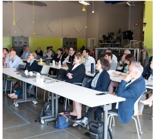
Lab Mobilité pour Tous : partage d'expertise